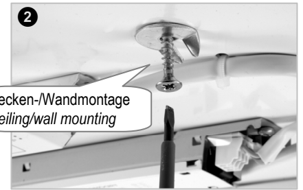
Decken-/Wandmontage Ceiling/wall mounting

Über Bajonettverschluss Montagebox abnehmen/befestigen. Remove/fasten mounting box via bayonet catch.